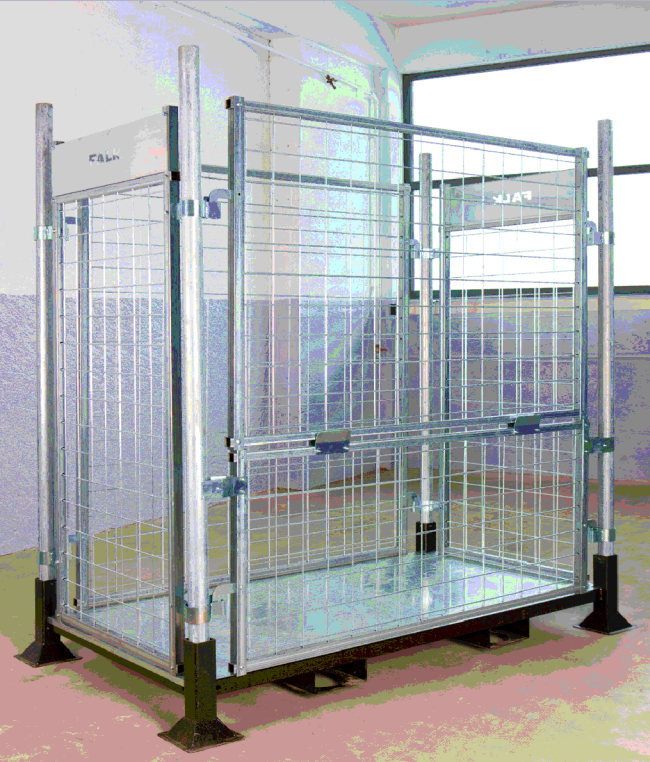
Cloison grillagée galvanisée